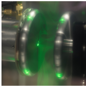
Figure 1 : dispositif expérimental

Cette étude s'intéresse à la génération et à la caractérisation du vent ionique produit entre deux plaques parallèles à l'aide d'un microplasma pulsé nanoseconde répétitif. Le microplasma est généré au sein d'une cavité située sur l'une des plaques, tandis qu'un champ électrique continu est appliqué entre les deux plaques. Dans cette configuration, des écoulements gazeux atteignant des vitesses de l'ordre de 4 \text{ m.s}^{-1} ont été observés et analysés par vélocimétrie par images de particules (PIV) bidimensionnelle à deux composantes, à une fréquence d'échantillonnage de 10 kHz. Les mesures simultanées de tension, de courant et de courant continu traversant les plaques ont permis de corrélérer les données de courant enregistrées avec les accélérations gazeuses obtenues par PIV haute vitesse, afin de déterminer les propriétés de transport des espèces chargées migrant du microplasma vers la plaque opposée.